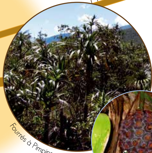
Fourrés à Pimpins