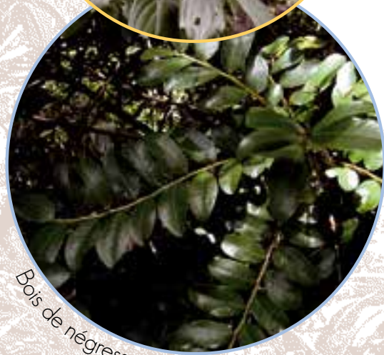
Bois de négresse