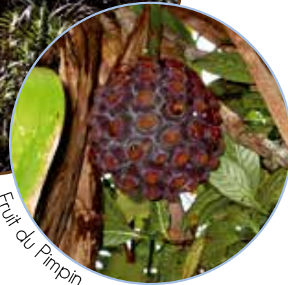
Fruit du Pimpin