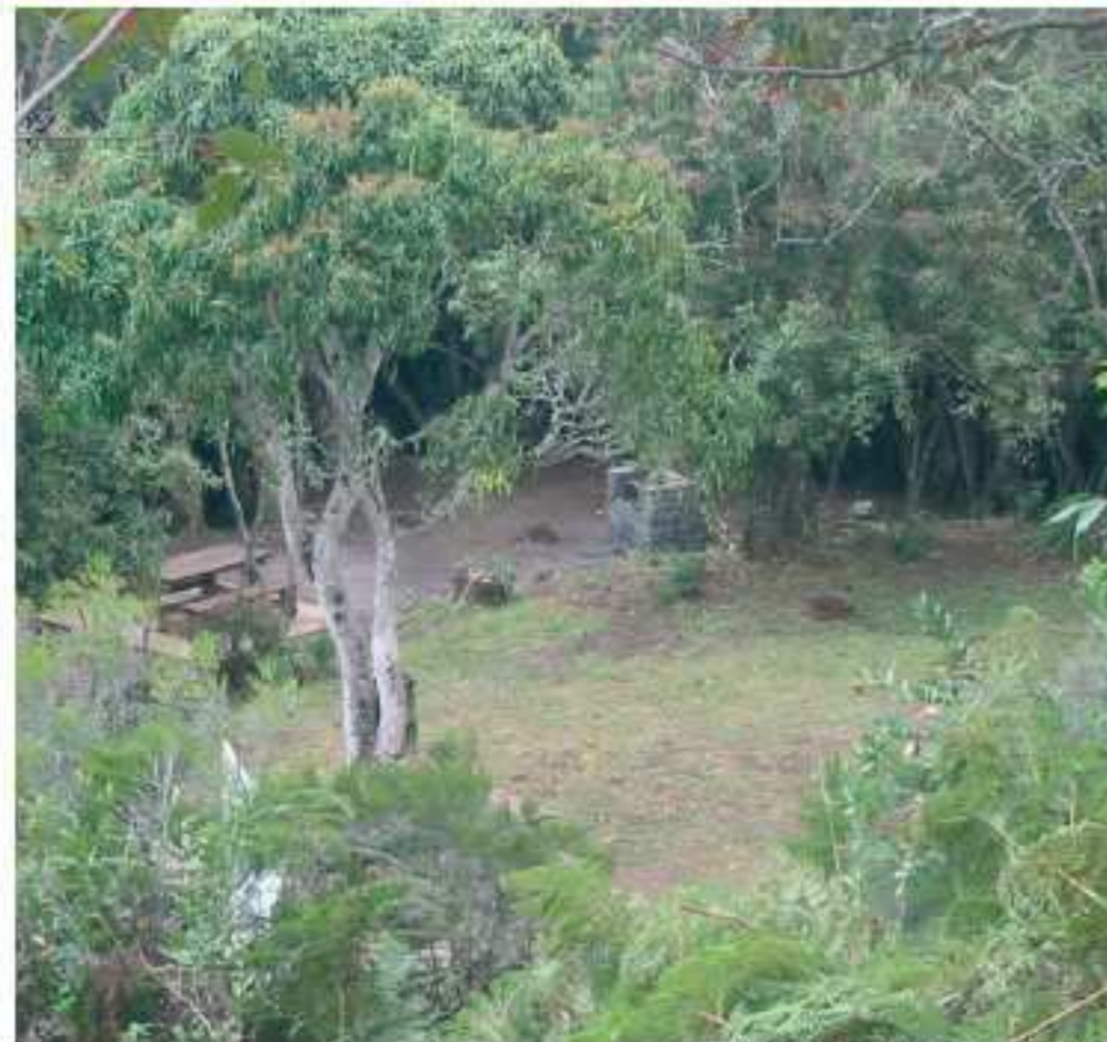
Département de La Réunion

L'accès est gratuit toute l'année, des visites guidées sont proposées par le CEN Réunion (5 € par personnes, 4 € pour les scolaires). Réserver au 0692 64 46 21 ou au 0692 69 18 63.