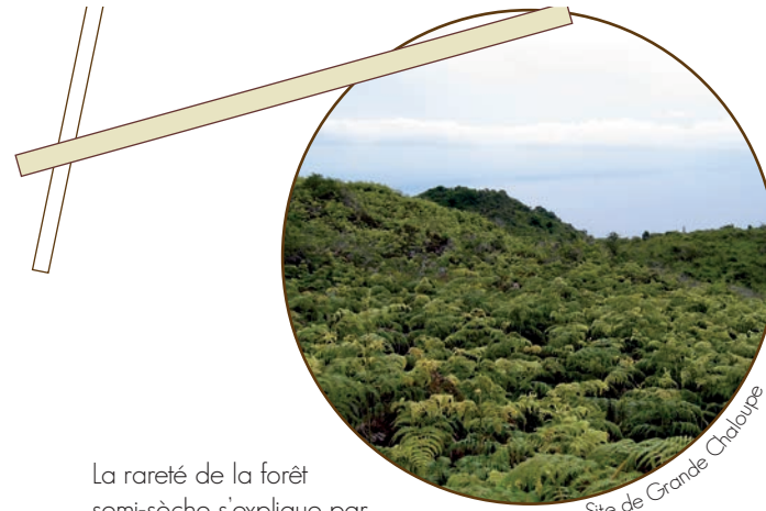
Site de Grande Chaloupe

La rareté de la forêt semi-sèche s'explique par son accessibilité et la fragilité des espèces qui la composent. Les premiers arrivants ont en effet rapidement exploité et défriché les zones littorales et celles de basse altitude où se trouvaient ces formations : défrichage pour la culture et le pâturage, coupe de bois pour le chauffage ou la construction d'embarcations.