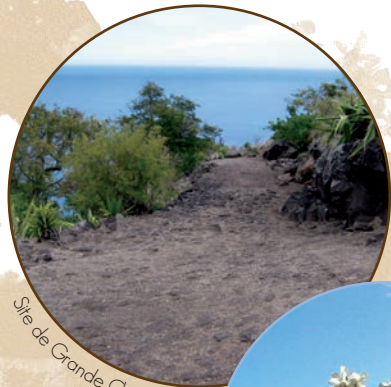
Site de Grande Chaloupe

* Forêt primaire composée d'espèces rares fortement menacées, présente sur l'Ouest de l'île entre 200 et 750 m d'altitude. Patrimoine naturel unique au monde, relique de moins de 1 % de la surface originelle.