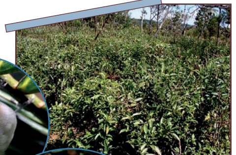
Plantation de thé