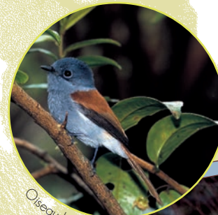
Oiseau la Vierge