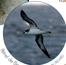
Pétrel de Barau

Du mois d'août au mois de mai, installez-vous à la tombée de la nuit dans le prolongement de l'accès à Cilaos. Vous pourrez alors observer les Taille-vents ou Pétrels de Barau, qui reviennent de la haute mer vers les colonies de reproduction situées sur les pentes du piton des Neiges et du Gros Morne.