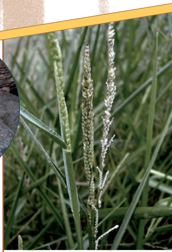
Herbe à riz