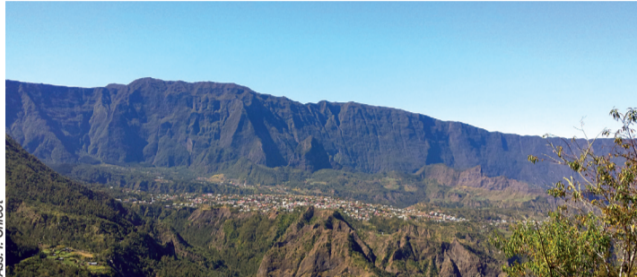
Ass. J. Chicot

Réputée auprès des randonneurs qui empruntent le sentier du Taïbit pour se rendre à Marla, la halte offerte par l'îlet des Salazes est bienvenue après 40 minutes de marche et 300 mètres de dénivelé positif. À l'accueil, les bénévoles de l'Association des 3 Salazes se relaient pour proposer des tisanes maison dont les vertus dynamisantes sont appréciées des marcheurs essoufflés. Connue pour ses actions à caractère social, l'association a pris une nouvelle direction. « Aujourd'hui, on veut se recentrer sur l'îlet et le faire découvrir aux visiteurs. Situé à