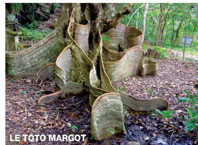
LE TOTO MARGOT