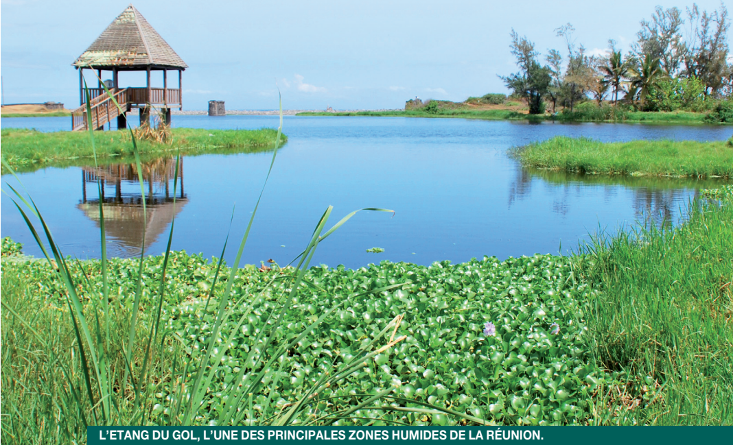
L'ETANG DU GOL, L'UNE DES PRINCIPALES ZONES HUMIDES DE LA RÉUNION.

LES ZONES HUMIDES, COMME DISENT LES SCIENTIFIQUES, DÉSIGNENT LES PLANS D'EAU, MARAIS ET AUTRES ZONES INONDABLES, GORGÉS D'EAU DOUCE, SALÉE OU SAUMÂTRE. LA VÉGÉTATION EST DOMINÉE PAR DES PLANTES AQUATIQUES PENDANT AU MOINS UNE PARTIE DE L'ANNÉE.