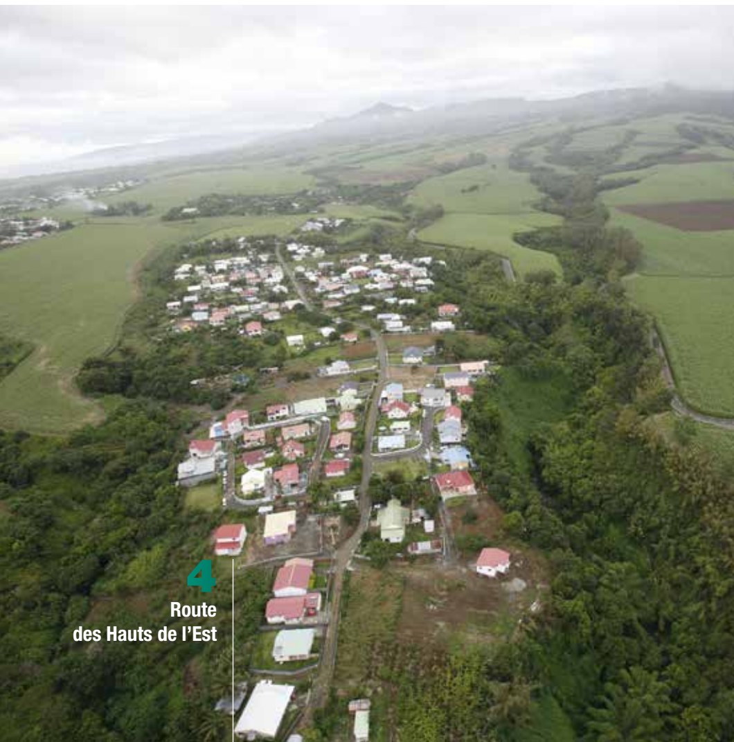
4 Route des Hauts de l'Est