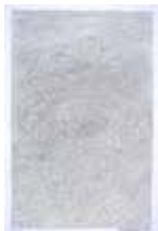
Kid Kreol & Boogie