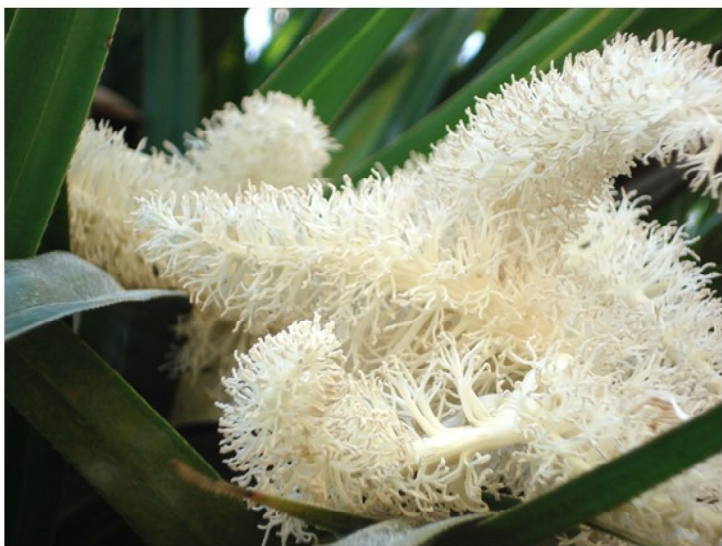
Inflorescence de Vacoa ( Pandanus utilis )

Les feuilles encore vertes sont séchées pendant 2, 3 jours, et tressées pour confectionner de magnifiques objets tels que le « Bertel » à 14.50€ , des dessous de verres à 7€ et bien d'autres produits encore vendus dans notre boutique.