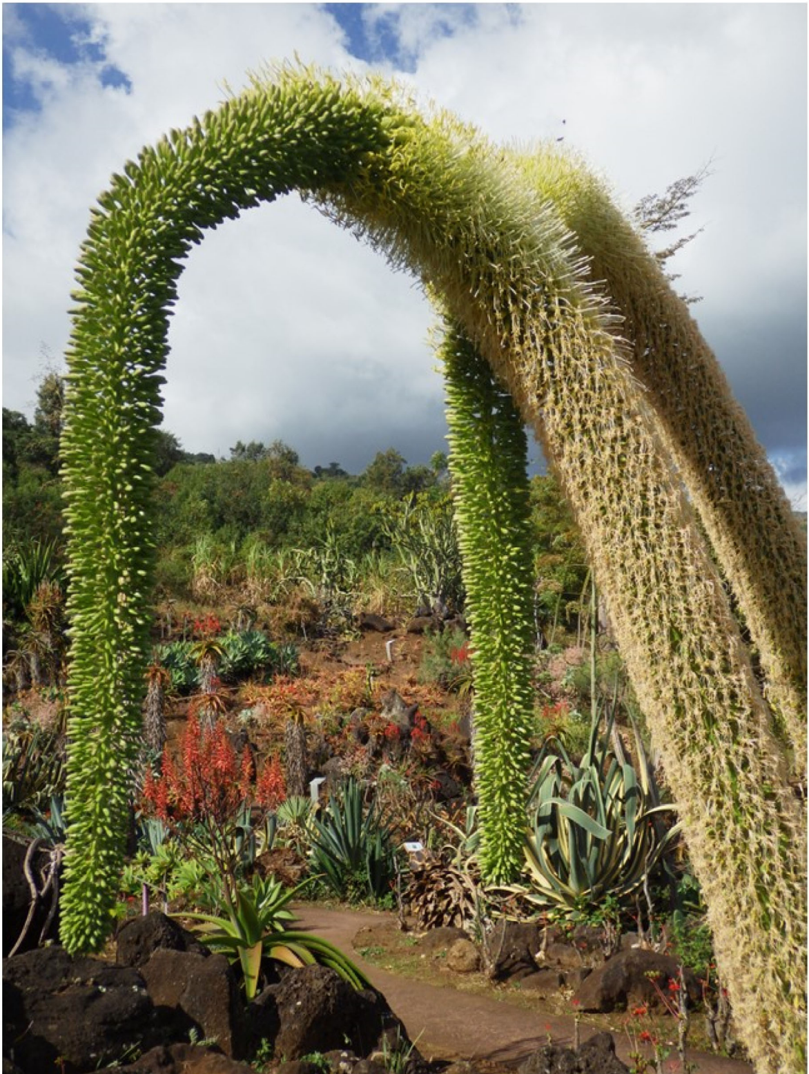
Agave à cou de cygne ( Agave attenuata )

Mascarin jardin botanique de La Réunion 2 rue du Père Georges - Les Colimaçons 97436 SAINT-LEU Tel : 0262 24 92 27 Mail : mascarin.jardinbotanique@cg974.fr