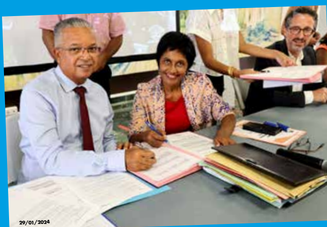
Le Président du Département a signé la convention relative au plan de sauvegarde de la copropriété de la Chaumière, à Saint-Denis.