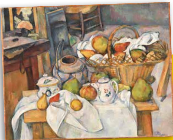
Paul Cézanne La Table de cuisine, entre 1888 et 1890 Huile sur toile, H. 65,0 ; L. 81,5 cm. Legs Auguste Pellerin, 1929

Elles intégreront temporairement la section impressionniste du parcours permanent et viendront s'inscrire historiquement entre des œuvres précurseuses, de l'École de Barbizon, et d'autres plus tardives, dites postimpressionnistes.