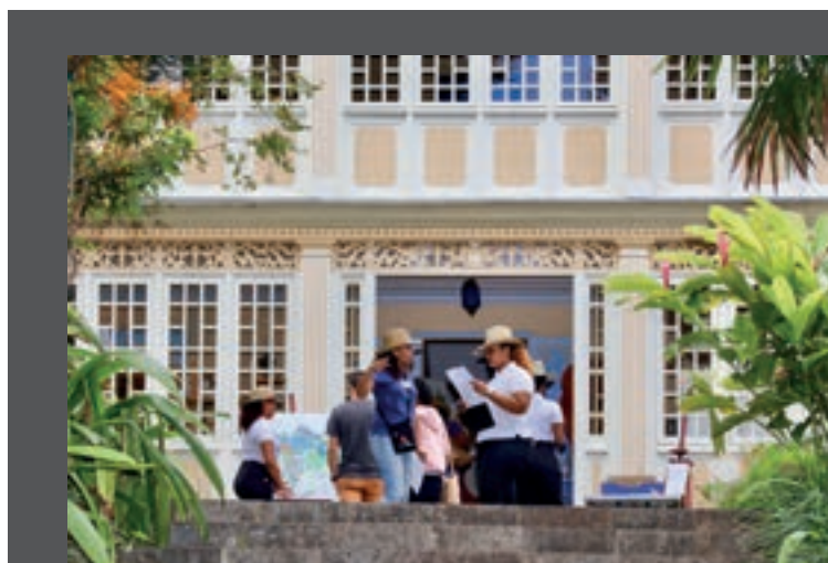
15/09/18 JOURNÉE DU PATRIMOINE