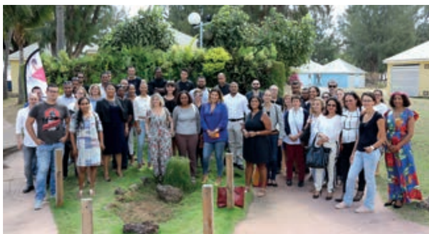
02/10/18 CHALLENGE DES CRÉATEURS