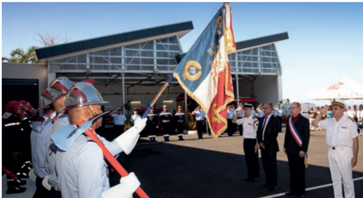
23/08/18 INAUGURATION DE LA CASERNE DES AVIRONS