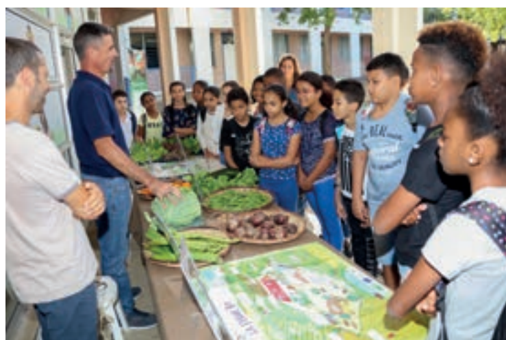
30/08/18 BIEN MANGER DANS LES COLLÈGES