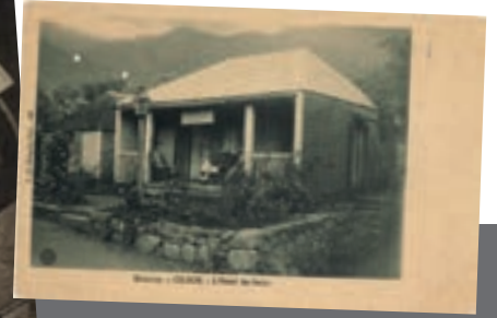
15P1.GM1.4 - 4. Cilaos. - Les Thermes G.M. Ca 1950