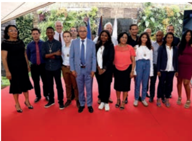
25/09/18 JEUNES DE LA DVE HONORÉS POUR ACTE DE COURAGE