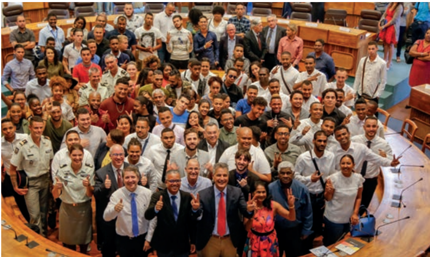
10/08/18 RÉCEPTION DES 174 JEUNES RECRUTÉS PAR LE CNARM DANS L'HÉMICYCLE DU PALAIS DE LA SOURCE