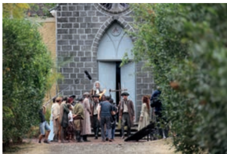
05/09/18 TOURNAGE « LA BUSE » DE WILLIAM CALLY À LA CHAPELLE POINTUE