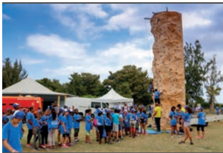
21/09/18 1ER CHALLENGE SPORTIF DÉPARTEMENTAL DES COLLÈGES À L'ETANG DU GOL