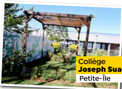
Collège Joseph Suacot Petite-Île